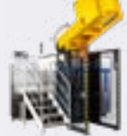
STERILWAVE 900 jusqu'à 180kg/h*

*avec une densité de déchets de 1L = 0,1 kg