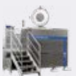
STERILWAVE 440 jusqu'à 88kg/h*