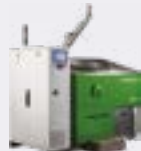
STERILWAVE 250 jusqu'à 50kg/h*