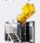
STERILWAVE 900 jusqu'à 180kg/h*

*avec une densité de déchets de 1L = 0,1kg