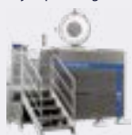
STERILWAVE 440 jusqu'à 88kg/h*