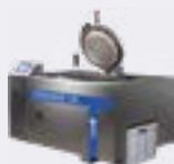
STERILWAVE 100 jusqu'à 20kg/h*