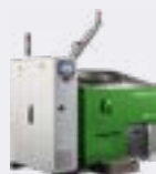
STERILWAVE 250 jusqu'à 50kg/h*