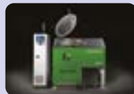
STERILWAVE 250 jusqu'à 50kg/h*