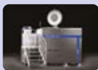
STERILWAVE 440 jusqu'à 88kg/h*