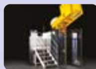
STERILWAVE 900 jusqu'à 180kg/h*