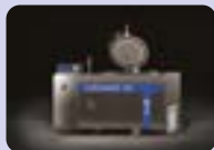
STERILWAVE 100 jusqu'à 20kg/h*