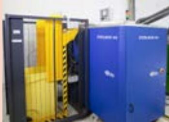
Sterilwave 440 capacité jusqu'à 88kg/h*