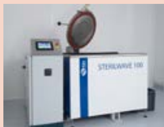
Sterilwave 100 capacité jusqu'à 20kg/h*